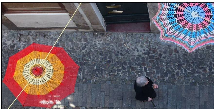
Moradora da Rua Fernandes Tomás

Transformámos uma rua comum da Baixa de Coimbra num local especial, símbolo da solidariedade intergeracional e com capacidade para surpreender os transeuntes que foram naturalmente convidados a circular por uma rua que normalmente não faz parte do seu roteiro turístico ou percurso habitual.